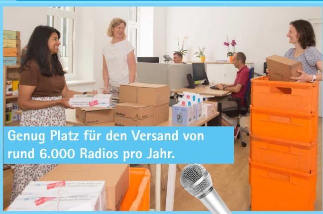
Genug Platz für den Versand von rund 6.000 Radios pro Jahr.

Ich danke der Muttergottes, dass sich der Versand hier weiter entwickeln kann. Wir wollen noch viele Radios und CDs versenden, um die Herzen vieler neuer und aller bestehenden Hörer für das heilsame Wort Gottes zu entzünden.